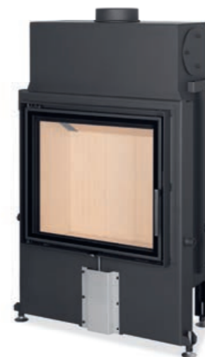
Impression 2G 67.60.01