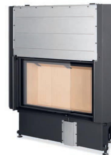
Impression 2G L 93.60.01