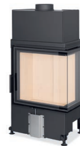
Impression R 2G S 58.60.34.21