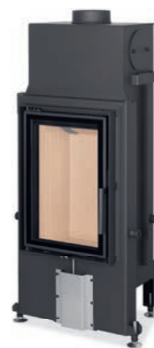
Impression 2G 42.60.01