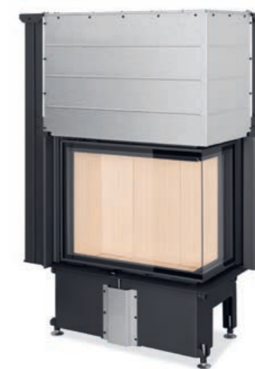
Impression R 2G L 71.60.34.21