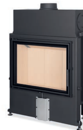
Impression 2G 80.60.01