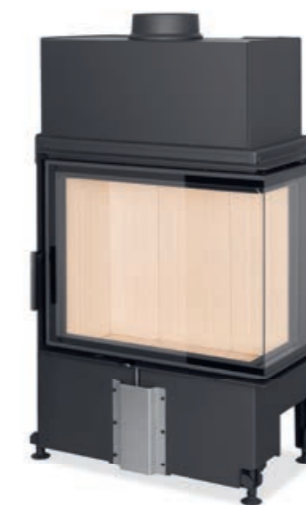
Impression R 2G L 71.60.34.21