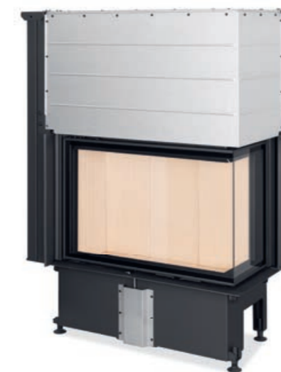
Impression R 2G L 83.60.34.21