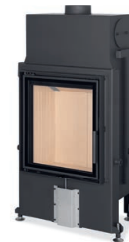
Impression 2G 55.60.01