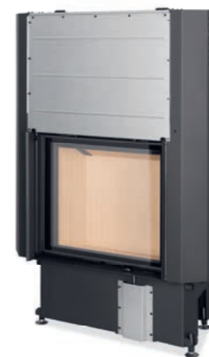
Impression 2G L 67.60.01