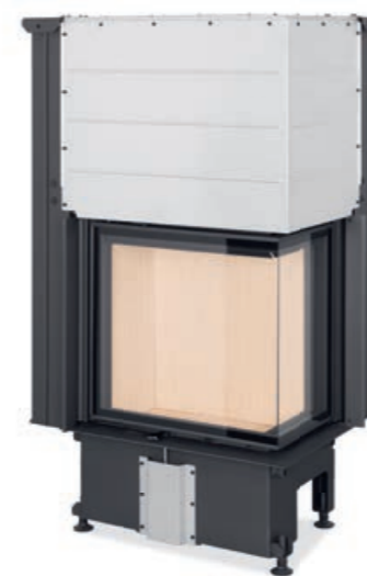
Impression R 2G L 58.60.34.21