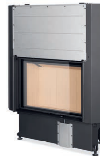
Impression 2G L 80.60.01